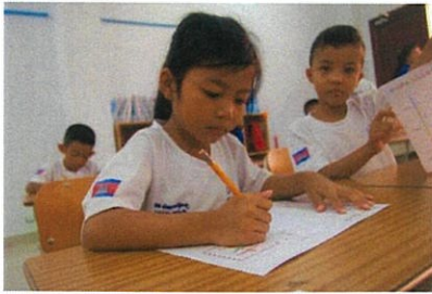
好きな動物、あそび、なりたい職業などを書きました。

小学部がスタートし、4 か月が経ちました。CLA では自己肯定感を育てるために「宝物ファイル」というプログラムを導入しています。自分の長所に目を向けていろいろなものをファイルに入れて形を残していくことで、自分も知らなかった自分を発見し、自分を大好きになることを目的としています。