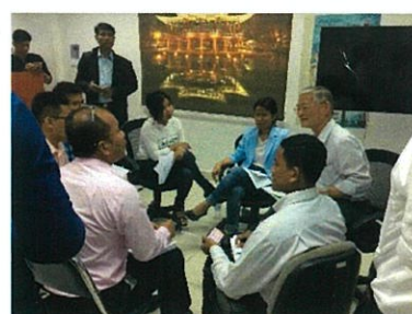
草の根支援「IT 人材育成」研修の様子