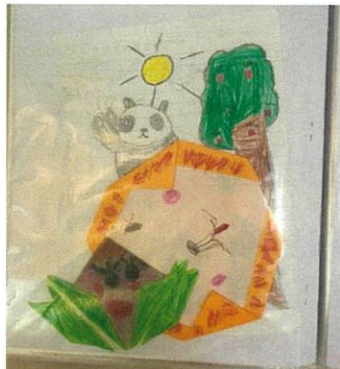
制作物などもこの中に保管しています。

CLA 内でのスタッフ研修の中にもこれを取り入れ、教える側のスタッフの自己肯定感も高められるように取り組んでいます。みんなのファイルにこれからどんな宝物がたまっていくのか楽しみです！