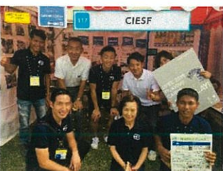
イベントでシーセフについてブース訪問者に説明をしました。

イベントでは多くの人に自分の国のことを伝えられて嬉しかったです。外国で良い活動をしている日本人が多く、そういった活動によって、世界の人々が共存していくことができるようになるに違いないと思いました。日本で経験したことをたくさんの人に伝えていきたいです。