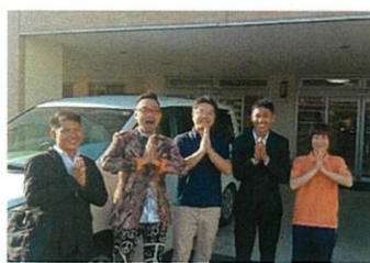
サポーターの会社を訪問して職業体験をさせていただきました。