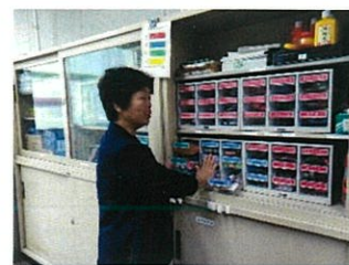
小学校を訪問して先生の仕事内容を伺いました。