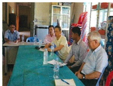
教員養成校での授業研究会のあと教官と意見交換している様子