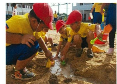
砂遊びを楽しむ CLA の子どもたち