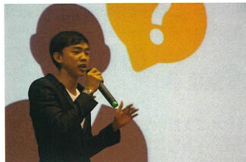
昨年の最終選考会の様子

シーセフは、カンボジアにおいて若手の起業家精神を育て、カンボジアの経済発展を促進するために、国立経営大学と協働で 2010 年よりカンボジアビジネスモデルコンテストを開催しています。今年は 10 回目という節目となり、2020 年 2 月 2 日の最終審査に向けて現在 1 次選考を行っております。