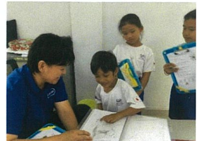
「好きな動物は〇〇です！」人に話すことが嬉しい子どもたちです。