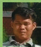
ブンヘン (国境なき教師団サポートスタッフ)

イベントでは多くの人に自分の国のことを伝えられて嬉しかったです。外国で良い活動をしている日本人が多く、そういった活動によって、世界の人々が共存していくことができるようになるに違いないと思いました。日本で経験したことをたくさんの人に伝えていきたいです。