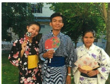
スパイリエン大学のジャパンフェアで日本文化に触れる学生