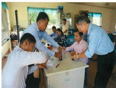
教員養成校で教官と授業研究をする教育アドバイザー