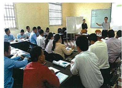
教育政策大学院大学で講義を行っている様子