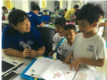
自分の好きなものを先生に紹介しました。