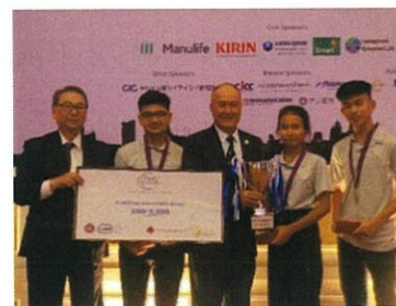
昨年の表彰晩餐会の様子