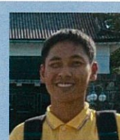
ホン (国境なき教師団サポートスタッフ)

小学校を見学して、子どもたちは自分で片付けたり、掃除していてとても素晴らしいと思いました。給食も食べることができ嬉しかったです。カンボジアの教育の質・教師の質の向上のため CIESF で一生懸命頑張って働きたいです。